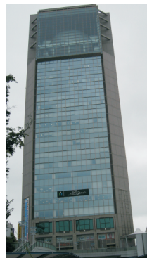
会場のビッグアイ

全国のうつ自殺者の遺書や生前の写真などが並ぶ「私の中で今、生きているあなた」は初めて。遺書や生前N福島 郡山は二十の写真、遺族の手記、遺書や手記など展示